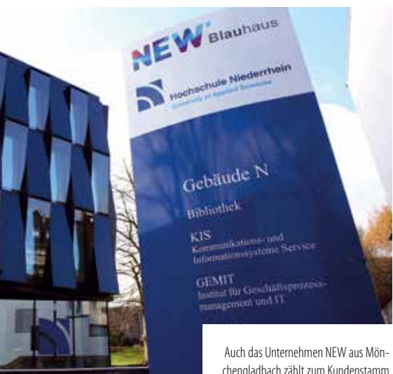
Auch das Unternehmen NEW aus Mönchengladbach zählt zum Kundenstamm

Eine enge Kooperation mit Kunden und Veranstaltern ist laut Schräger-Enkirch unerlässlich. Schließlich spielen heute die Medien- bzw. Veranstaltungstechnik eine wichtige Rolle in der Architektur von Gebäuden und Messeständen. Wenn gewünscht, betreut SIGMA den Auftraggeber ganzheitlich, von der Beratung über die Installation oder technische Betreuung bis hin zur Content-Erstellung für unterschiedlichste Wiedergabemedien. ▶