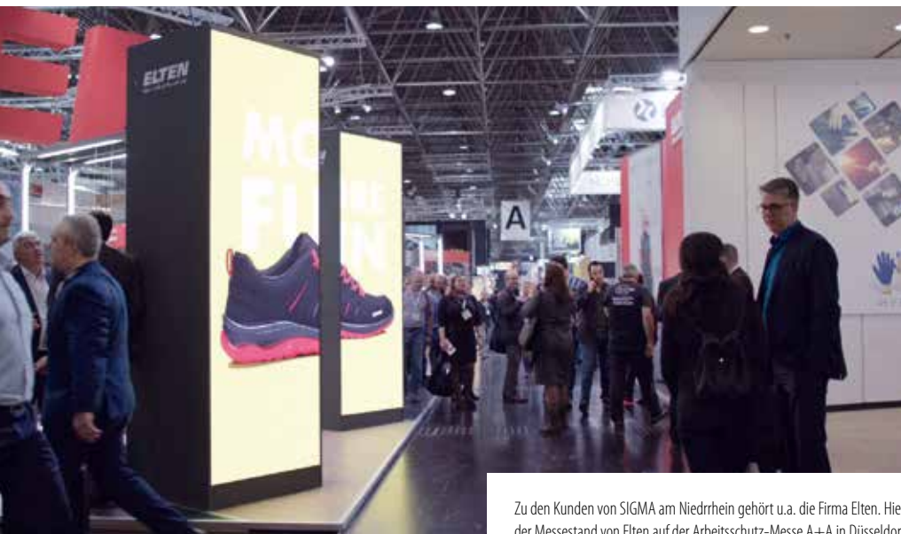
Zu den Kunden von SIGMA am Niederrhein gehört u.a. die Firma Elten. Hier der Messestand von Elten auf der Arbeitsschutz-Messe A+A in Düsseldorf